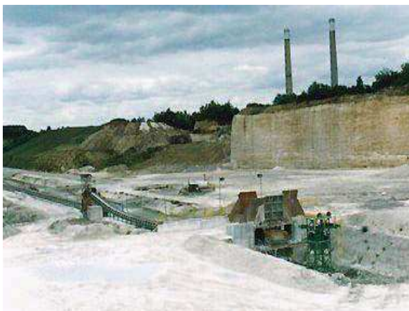
Carrière moderne à ciel ouvert

Les carrières à ciel ouvert ont toujours perduré surtout quand elles étaient éloignées des grandes villes. Pour des raisons de mécanisation et de rentabilité les carrières de calcaire grossier actuelles sont quasiment toutes aériennes. Cela est devenu possible grâce aux engins puissants. La pénébilité du métier de carrier n'est plus qu'un souvenir !