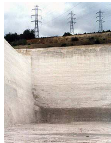
Front de taille d'une carrière moderne