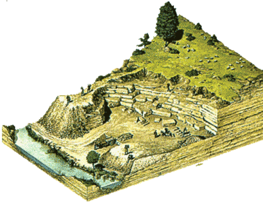
Front de taille à ciel ouvert à l'époque gallo-romaine

De l' époque gallo-romaine jusqu'au haut Moyen-Age le calcaire était exploité le long des coteaux des rivières (comme la vallée de la bièvre) où il était accessible sans creuser. A cette époque les carriers ne savaient pas distinguer les différentes qualités de pierre et tout était exploité. Cela explique la mauvaise conservation de certains monuments gallo-romains.