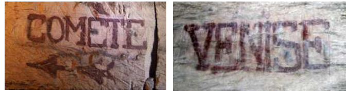
Noms de champignonnières, à Méry-sur-Oise