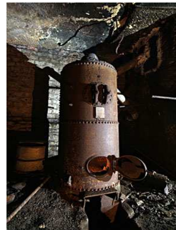
Chaudière à charbon (Carrières)