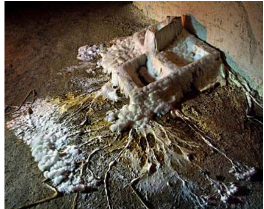
Cagette attaquée par des champignons saprophytes (Carrières)