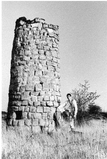
Partie extérieure d'une cheminée d'aération (Carrières-sur-Seine)