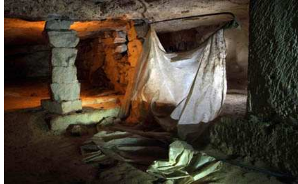
Reste de cloison plastique, à Herblay