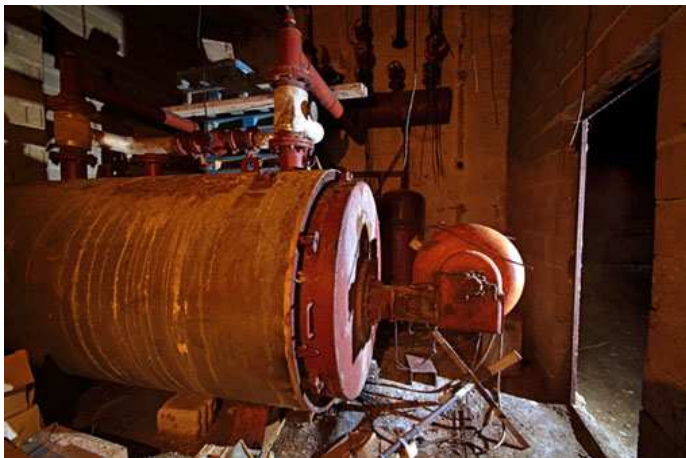
Chaudière à pétrole (Carrières)

Rapidement, les champignonnistes ont mis en place des chaudières destinées à réguler la température de plusieurs champignonnières à la fois. La chaleur était diffusée soit par des conduites d'air chaud, soit par des radiateurs fixés sur les parois calcaires. Les chaudières se sont modernisées progressivement et ont gagnées en puissance. Le mode d'énergie évolua également passant du bois, au charbon et enfin au pétrole ou à l'électricité.