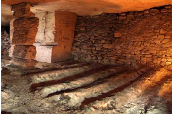
Chambre de culture limitée par des murs de pierres, à Méry-sur-Oise

Les champignonnistes ont cloisonnés les chambres de culture avec divers matériaux suivant les époques. Au début des champignonnières, ils construisaient des murs en pierres sèches , à la manière des hagues d'exploitation. Ces cloisons de pierres ont laissé la place, plus tard, à des cloisons de plaques de plâtre , dont l'édification était moins fastidieuse. Enfin, avec l'ère du plastique, les cloisons ont été réduites à de simples films plastiques. Ces derniers sont très facilement déplacés selon les besoins.