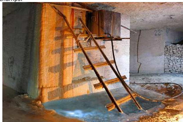
Réservoir métallique de collecte d'eau (Méry)