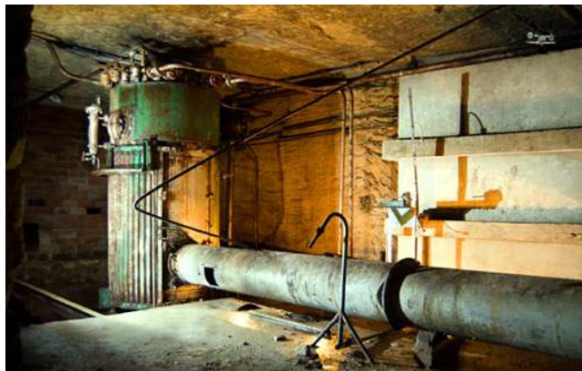
Chaudière à air (Méry)