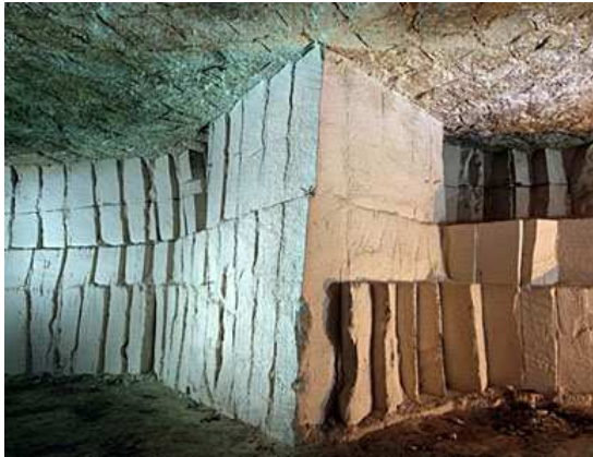
Murs entièrement chaulés de façon mécanique (Carrières)

D'autre part, entre chaque cycle de culture de 3 mois, la cave est complètement vidée, chaulée et les supports de cultures (comme les cagettes) sont désinfectés dans des bains de formol . Dans les exploitations modernes, on traite également la cave à l'aide d'un fongicide, qui détruit les éventuels spores de champignons parasites.