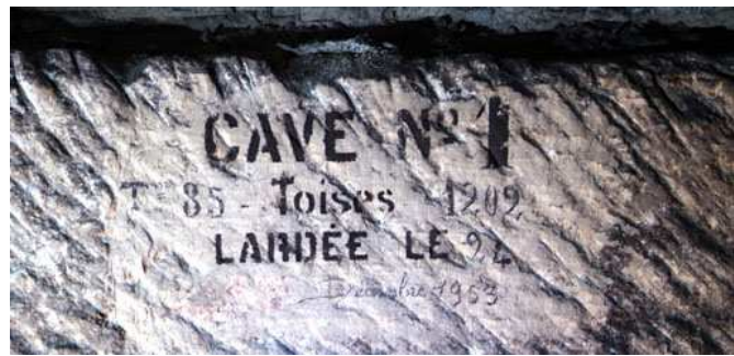
"Cave N°1" lardée le 24 décembre 1953, à la Savonnière en Perthois