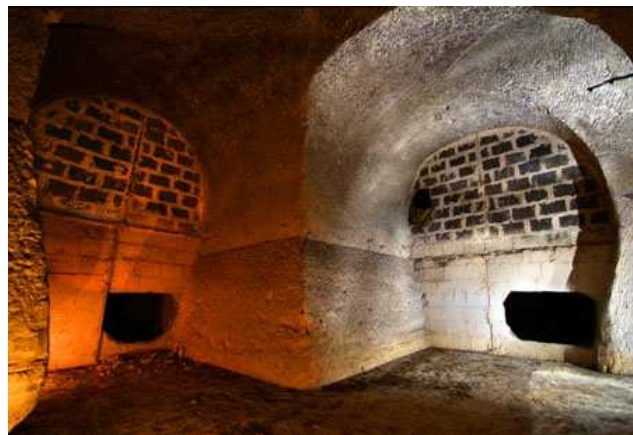
Cloison en plâtre à Marly-le-roi