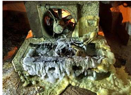
Ancien ventilateur (Carrières-sur-Seine)