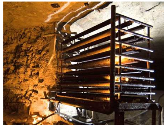
Radiateurs à eau (Méry)