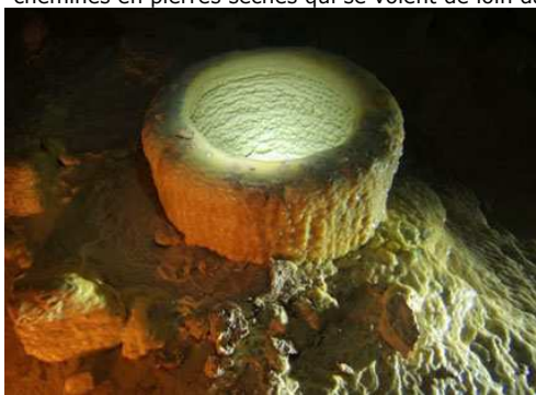
Fût en métal recouvert de calcite

- abaissant le taux d'humidité grâce à une ventilation. Cette ventilation se faisait par de simples trous, à ouverture modulable, dans les cloisons. Par la suite, ils furent équipés des ventilateurs électriques. L'aération globale de la carrière était assurée par des puits d'aération communicant avec la surface. Ces puits étaient creusés spécifiquement ou correspondaient à une réutilisation d'anciens puits d'extraction. Le plus souvent, ils sont rehaussés en surface par des cheminés en pierres sèches qui se voient de loin dans les champs.