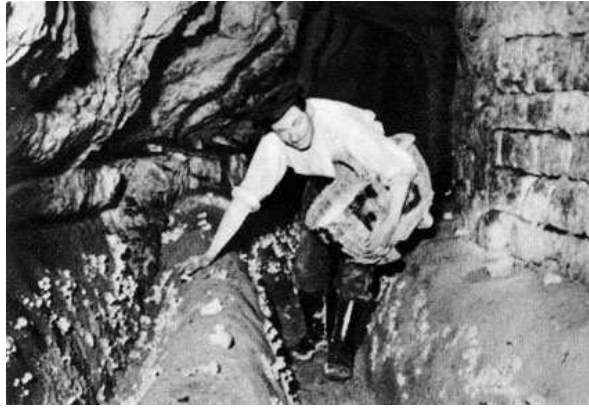
culture des champignons en banlieue sud