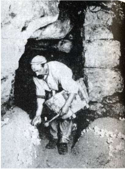
Champignonniste en 1908