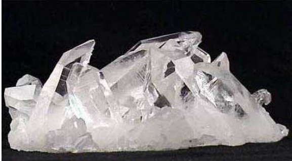
Minéral de quartz

D'abord, rappelons que la craie se forme à partir de coquilles carbonatées de plancton au niveau de lagunes.