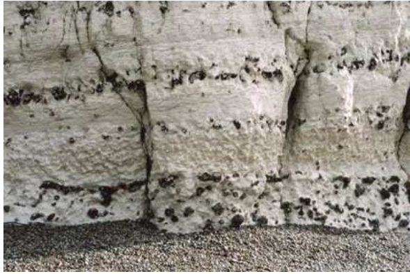
Falaise de craie avec des couches de silex