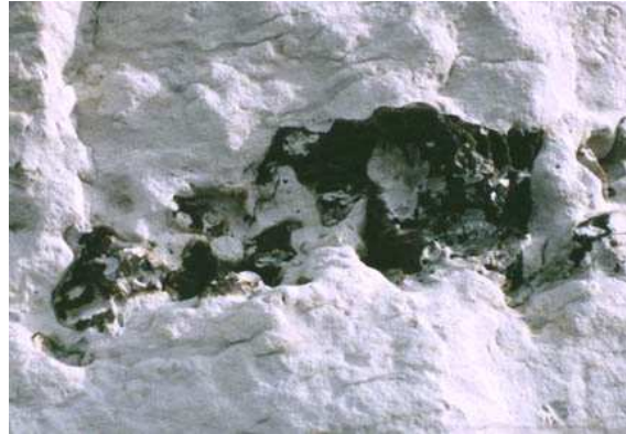
Rognons de silex

Dans ces lagunes se développe une grande quantité de microorganismes le plus souvent à squelette carbonaté. Cependant, il en existe une minorité à squelette siliceux. La plupart du temps, on obtient donc des boues largement carbonatées qui engendreront de la craie. La faible proportion de silice sera intégrée à l'argile présente dans la craie. Cependant par moment, les conditions du milieu changent et la quantité d'oxygène de l'eau des lagunes diminue (Le milieu est hypoxique ). Ces nouvelles conditions sont alors à l'avantage des espèces à squelette siliceux. Leurs populations augmentent et supplantent celles à squelettes carbonatés. Les boues deviennent alors siliceuses et donnent des silex.