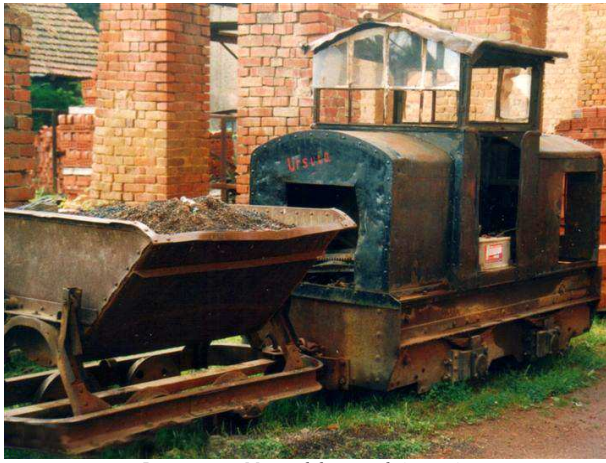
Locotracteur Massard dans une briqueterie