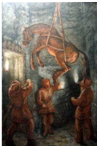
Descente d'un cheval dans à l'aide de lanières

C'est avec l'essor de l'ère industrielle, au 20 ème siècle, que la machine remplaça l'animal.