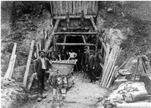
Sortie de mine avec un âne

- Dans la majorité des cas, on avait recouru à la traction animale . Le plus souvent un seul animal (cheval ou âne) tirait un seul wagonnet. Dans ce cas, la carrière devait posséder des bouches de cavage pour l'entrée des animaux. Néanmoins il était possible de descendre les chevaux par les puits d'extraction via des sangles !!