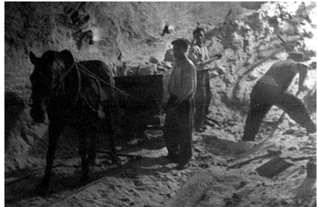
Traction à cheval dans une mine de sel en Pologne

C'est avec l'essor de l'ère industrielle, au 20 ème siècle, que la machine remplaça l'animal.