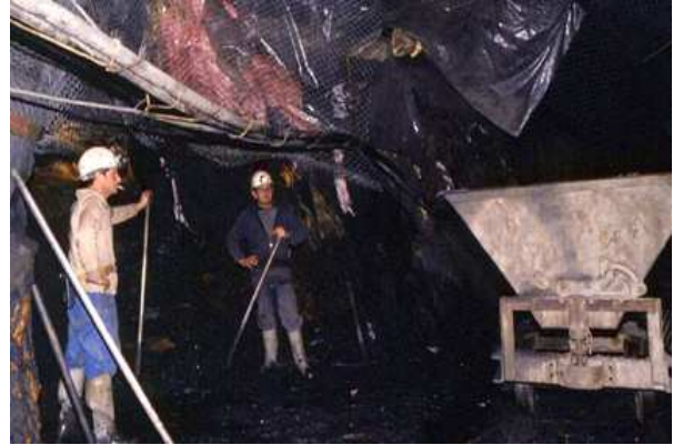
Le même wagonnet, mais complet, dans une carrière d'ardoise.