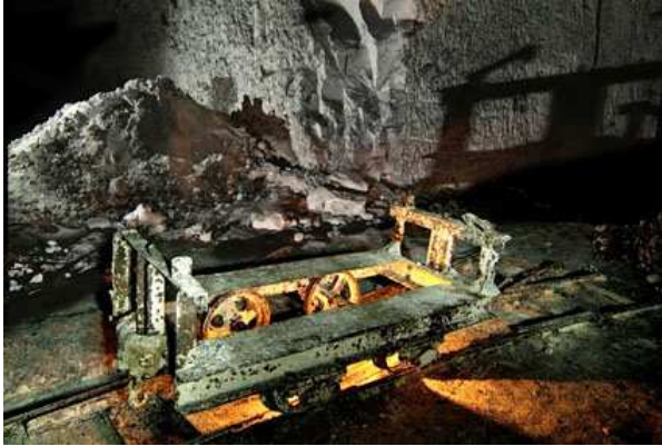
Socle du wagonnet encore sur des voies étroites

- Ce modèle incomplet (dont je n'ai pas trouvé la marque !) est présent dans la carrière "des Lions". La benne est peut être ailleurs dans la carrière !!