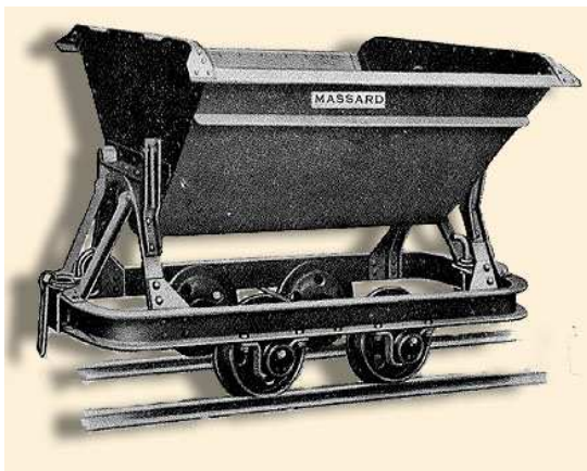
Wagonnet à bascule Massard, modèle standard (image extraite du catalogue Massard)