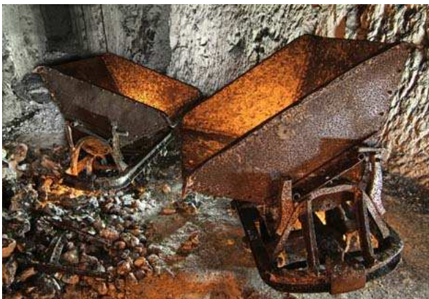
2 Wagonnets à bascule Massard dans la carrière "des Lions"

- Ce modèle de la marque "Massard" est présent dans la carrière "des Lions". Les fonderies "Massard" étaient situées en Allemagne.