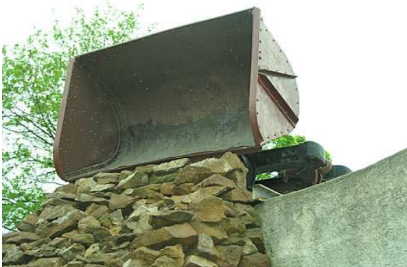
Wagonnet à bascule venant d'être déchargé.

Les wagonnets sont utilisés en carrière, sur les voies Decauville, pour transporter les pierres. Leur apparition correspond à l'avènement de l'ère industrielle.