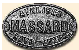
Plaque en fonte de la marque Massard apposée sur les wagonnets