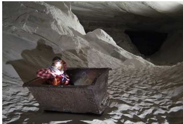
Benne de Wagonnet à la carrière du Puisselet.